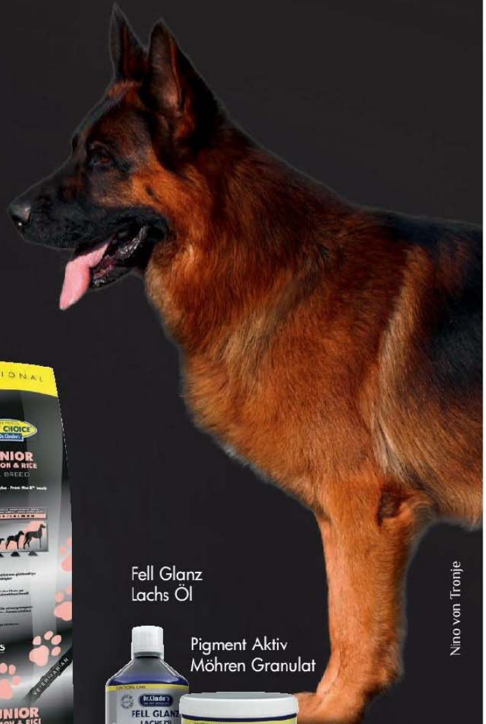
Nino von Tronje