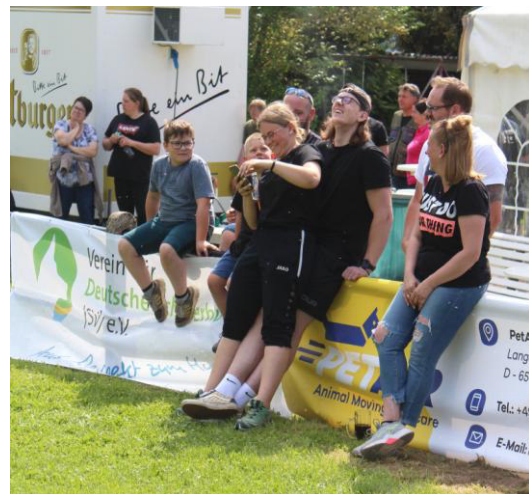
Und der Spaß kam auch nicht zu kurz