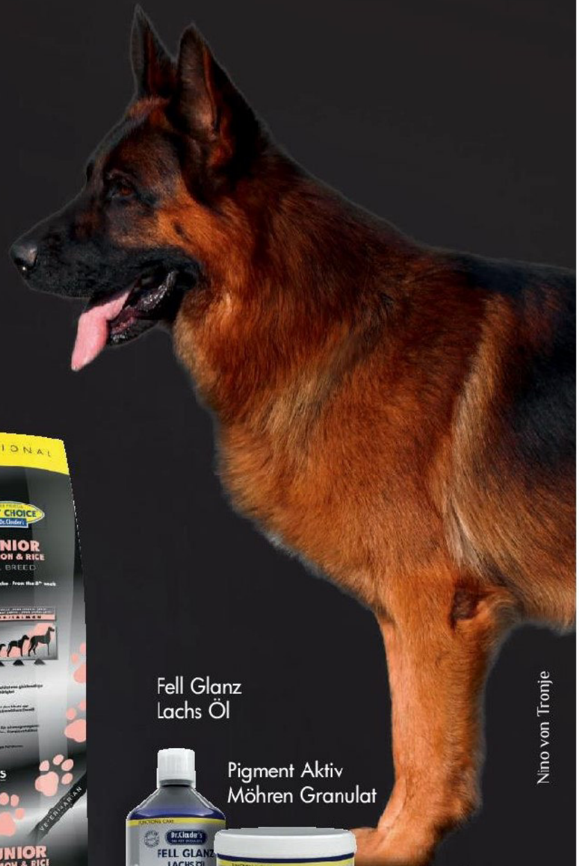
Nino von Tronje